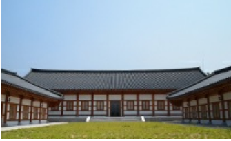
영암 목재문화체험장 靈巖 木材文化體驗場

새로운 건축문화로서 한옥건축의 현재와 미래를 체험하고 다양한 정보를 공유할 수 있다.