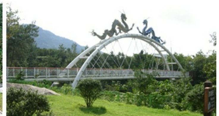
5코스 - 기찬랜드