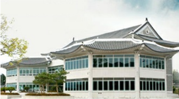
2코스 - 영암도기박물관