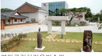
영암군립하정웅미술관 靈岩郡立河正雄美術館

동강 하정웅이 컬렉션한 미술품 3,036여점의 기증 계기로 세워진 공립미술관이다.