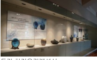
동강 하정웅컬렉션실 영암도기박물관 3층