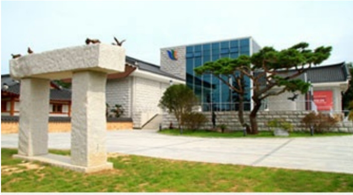
1코스 - 영암군립하정웅미술관