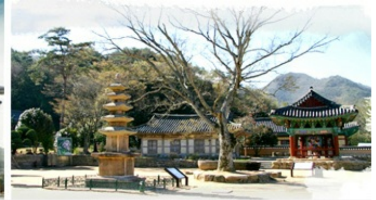
3코스 - 도갑사