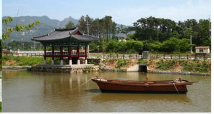
1코스 분기점 상대포역사공원