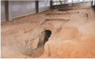
영암 구림리 요지 靈岩 鳩林里 窯址

통일신라시대 유약 바른 도기를 최초로 생산한 가마터이다. 출토 도기는 돌대장식대호, 사각편병, 주판알 모양의 유병 등 일상생활용 도기이다.