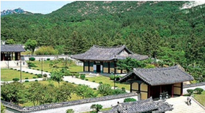
4코스 - 왕인박사유적지