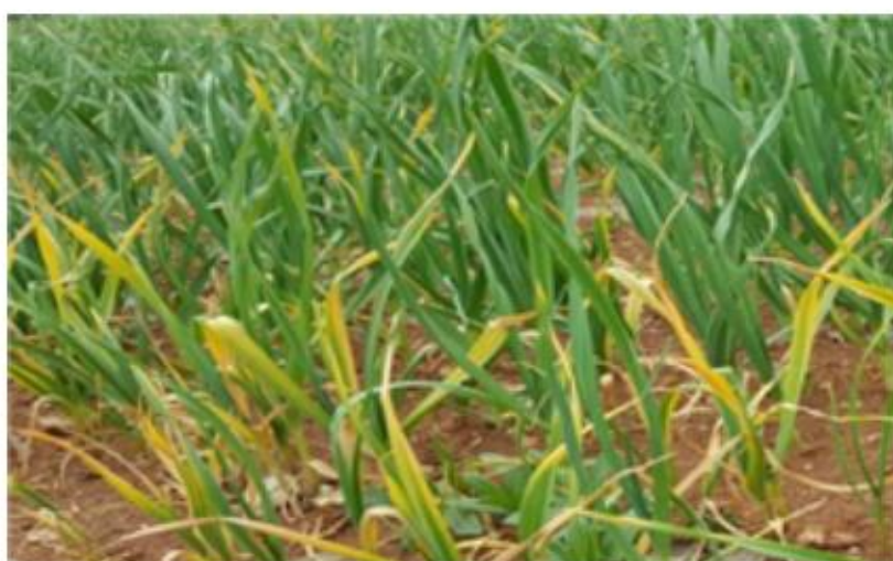
【마늘 발생 잎】