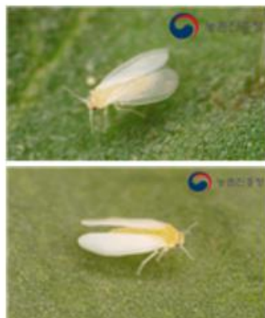
【온실(위), 담배(아래) 가루이】