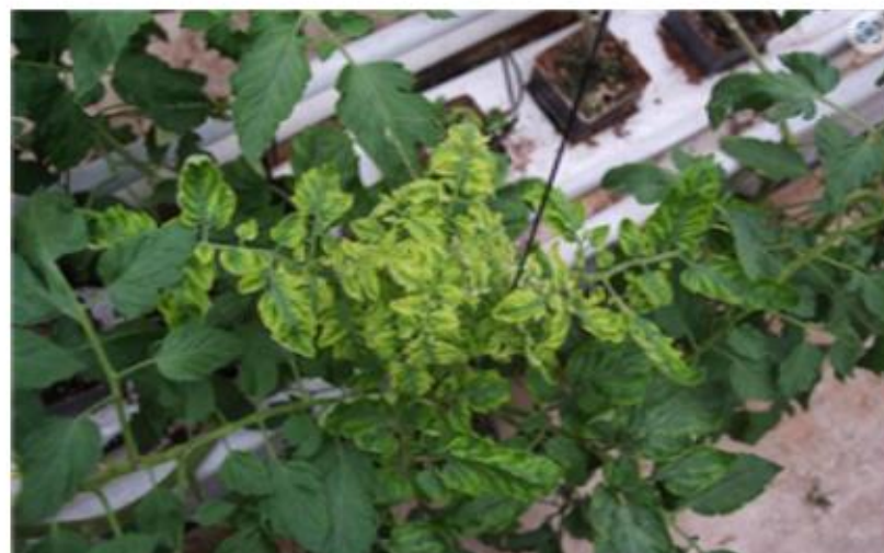
【토마토 피해 증상】