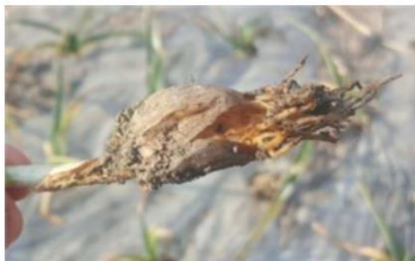
【마늘 피해 뿌리 병반】