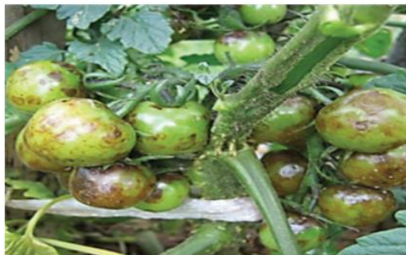
【토마토 열매 증상】