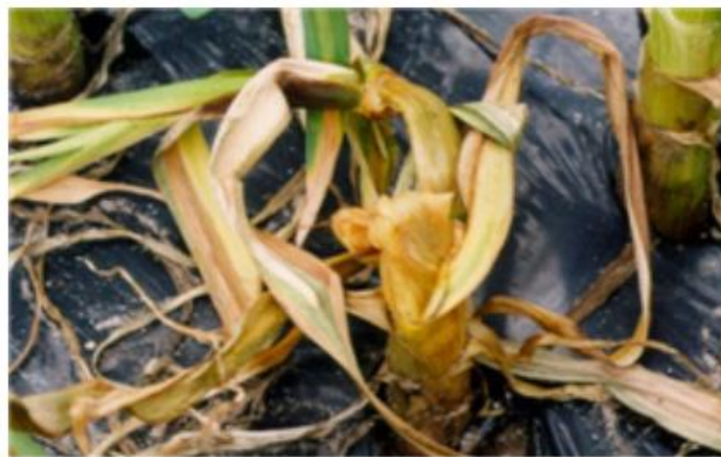
【병이 진전되어 줄기 전체가 물러짐】