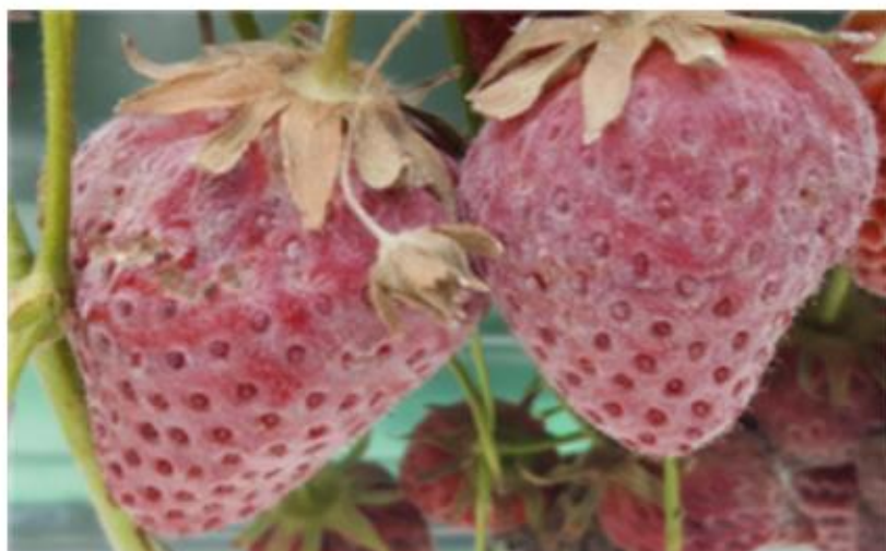
【딸기 열매 발생 증상】