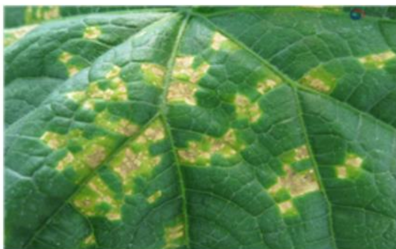
【오이 잎 증상】