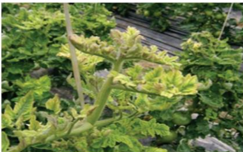
【토마토 피해 증상】