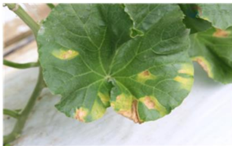
【멜론 잎 증상】