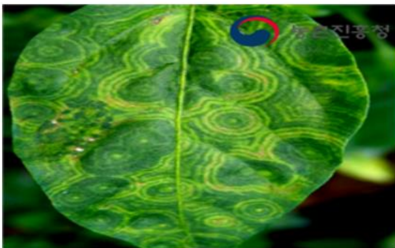
【토마토 잎 증상】