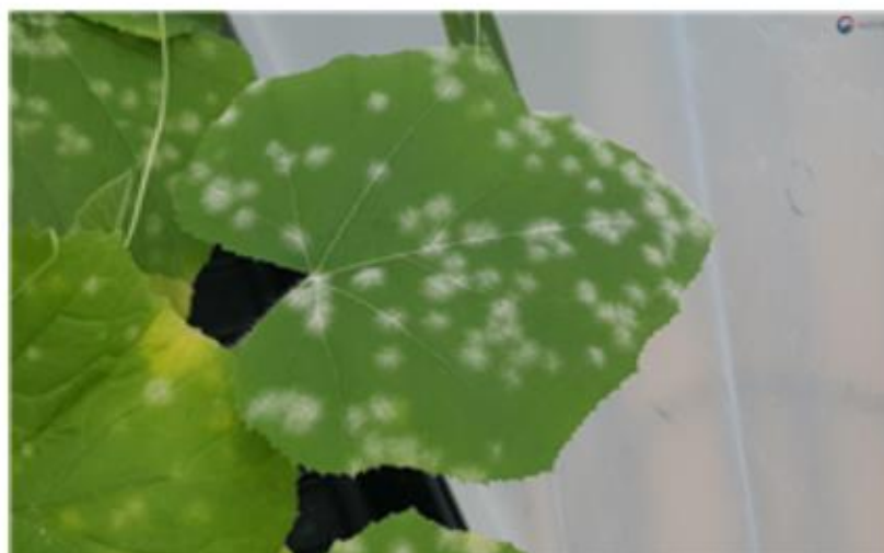
【오이 잎 발생 증상】