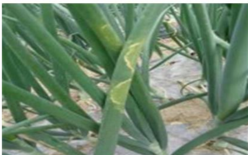
【양파에 발생한 소형 얼룩】