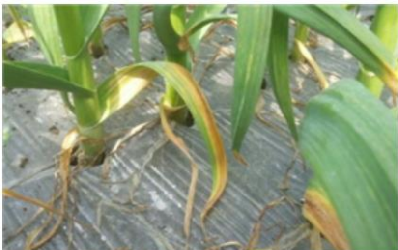
【아랫잎이 황화된 모습】