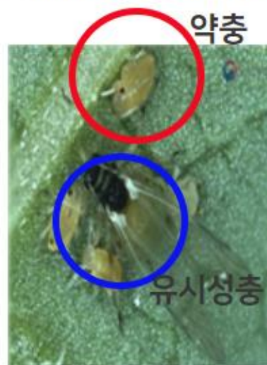
【목화진딧물 약충과 유시성충】