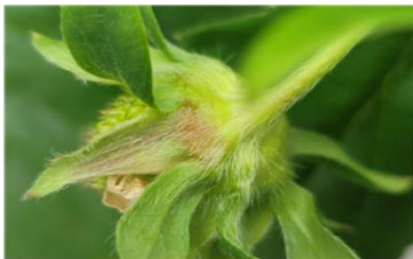
【딸기 발생 증상】