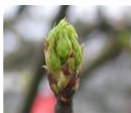
(다) 발아기와 전엽기 사이