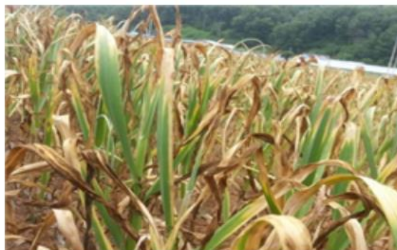
【마늘 피해 발생 포장】