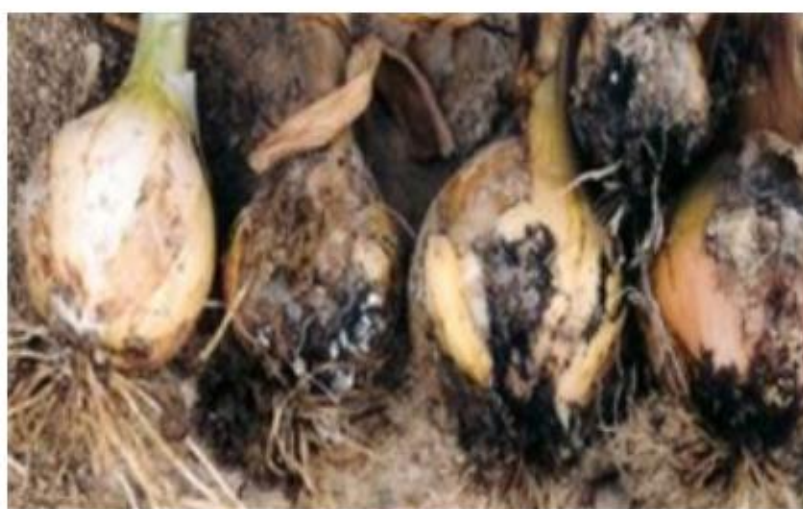
【양파 발생 인경 병반】