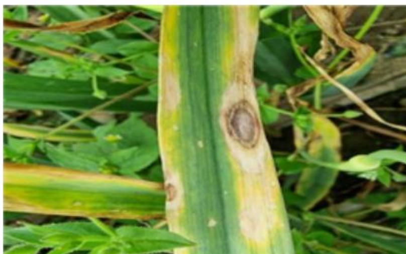
【마늘 피해 병반】