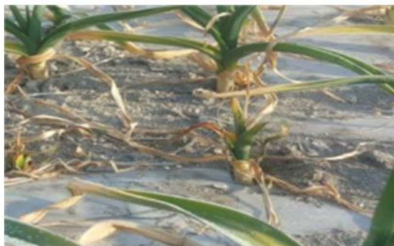
【다른 마늘에 비해 생육이 부진한 모습】