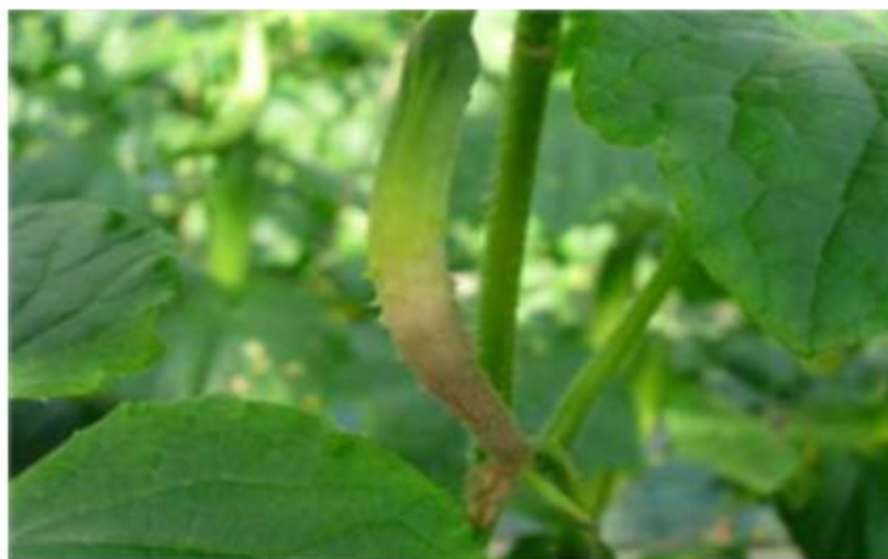
【오이 발생 증상】