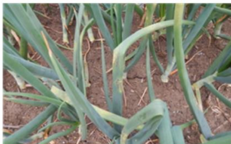
【양파 발생 포장】