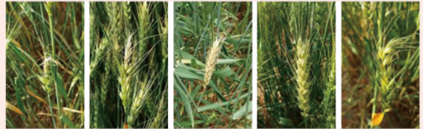
퇴화 부분불임 백수 탈색 이삭 휘어짐

피해 경감대책 습해에 약한 작물로 물빠짐 도량을 깊게 조성 복토 및 유기물(볏짚 등)로 덮어주기