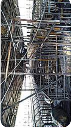
환풍기 과열에 의한 화재