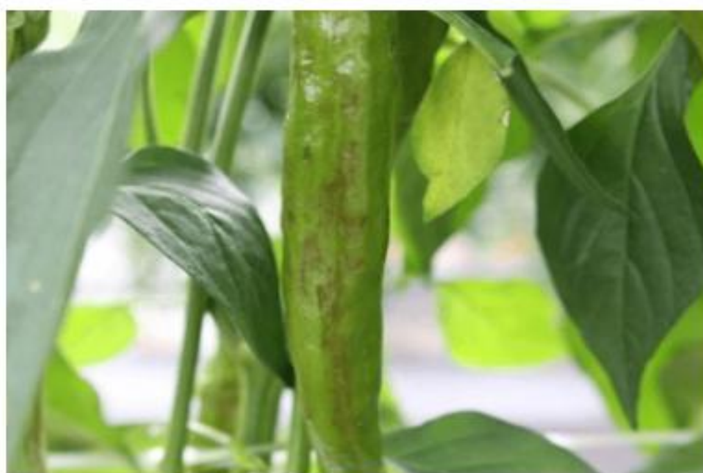
【CMV 발생 고추 열매】