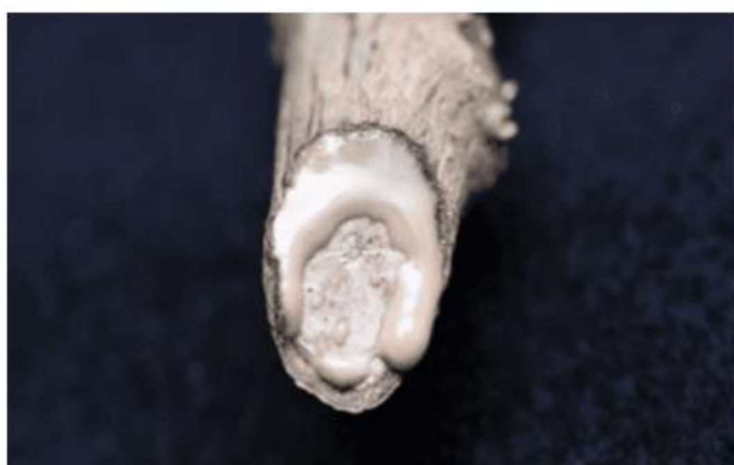
【풋마름병 발생 줄기, 백색 점액】