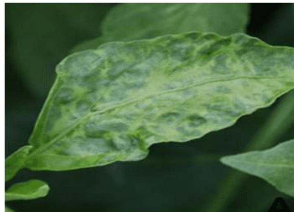
【BBWV2 발생 잎, 위축】