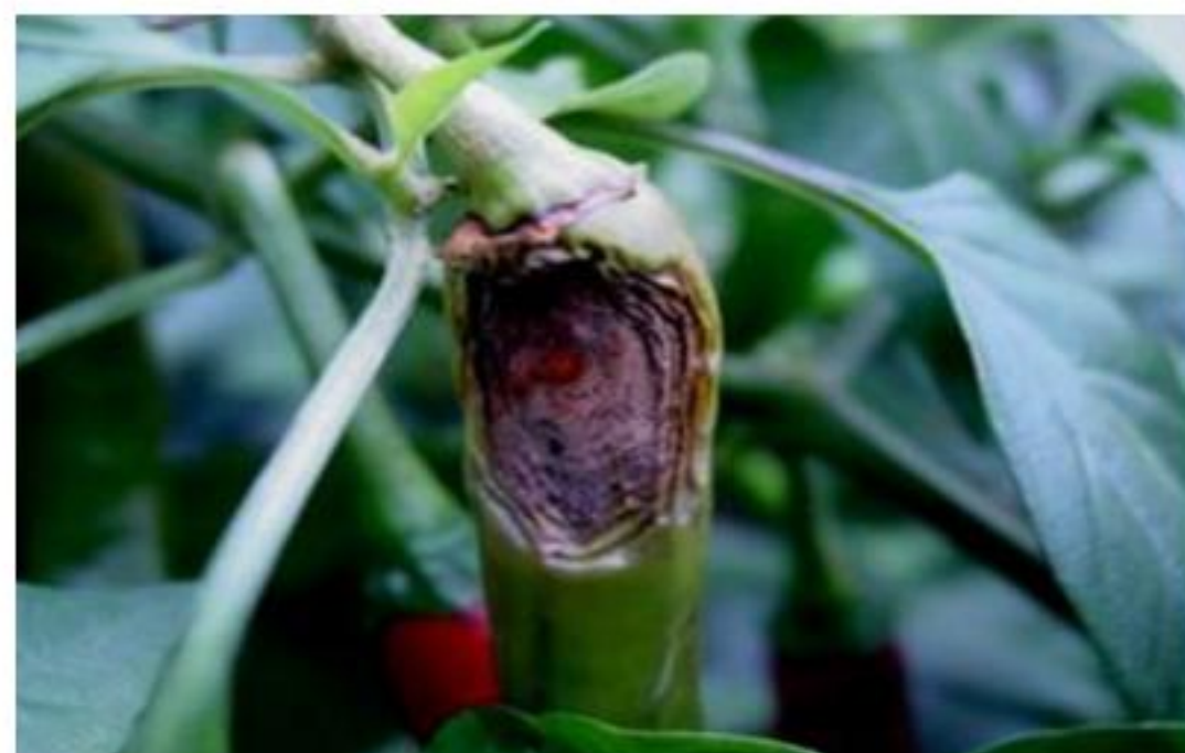
【고추 탄저병 병반】