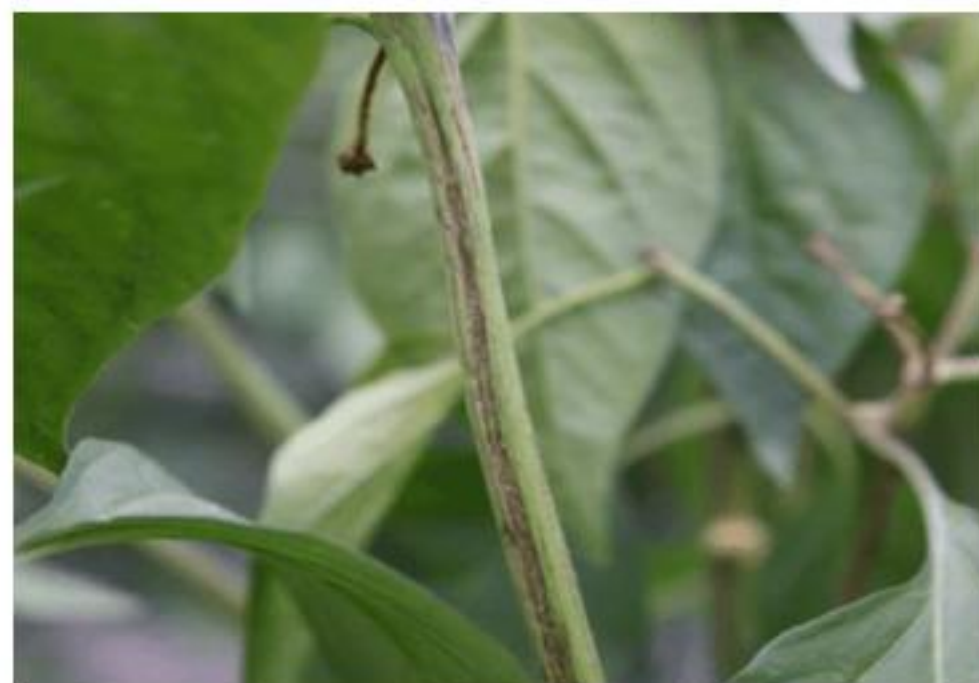
【CMV 발생 고추 줄기】