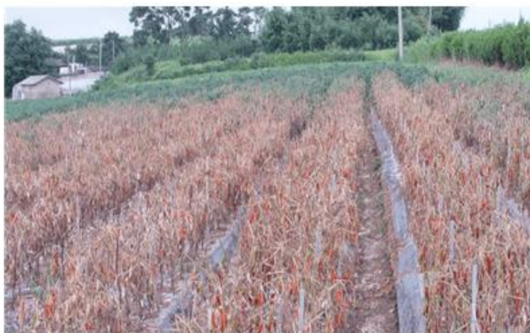
【고추 역병 발생 포장】