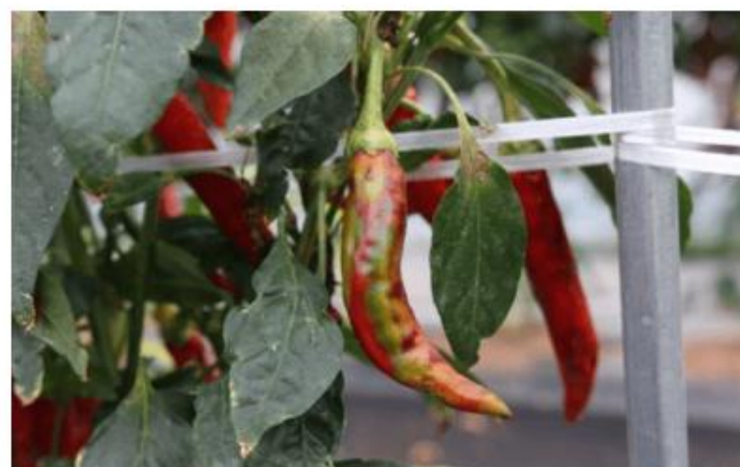
【TSWV 발생 고추 열매】