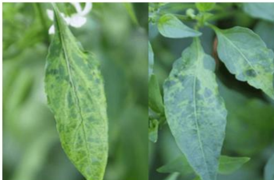
【BBWV2 발생 잎, 모자이크 반점】