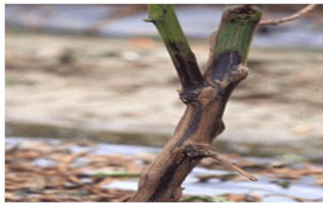
【고추 역병 발생 병반】