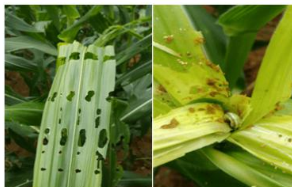
【열대거세미나방 유충(좌, 2령), 피해 사진(우)】