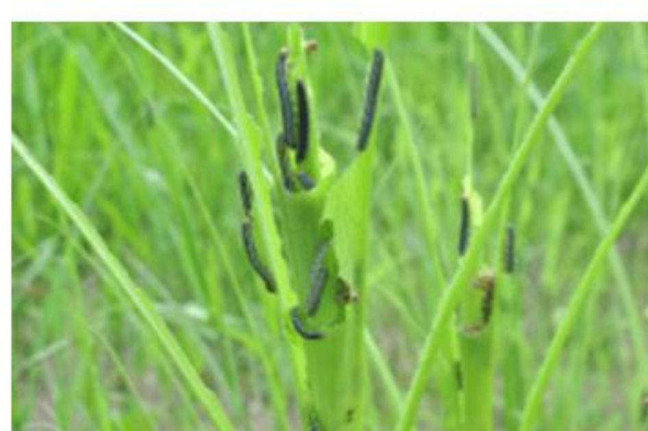
멸강나방 유충(좌) 피해(우)