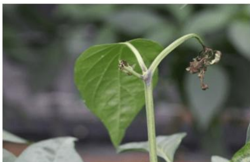
【TSWV 발생 줄기】