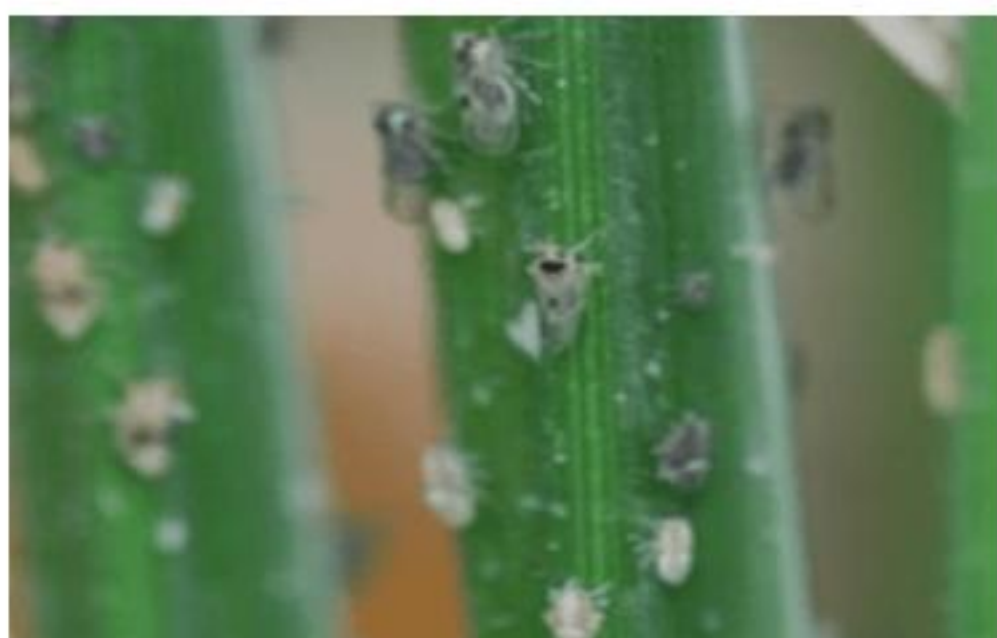
【이앙벼의 애멸구 성충 집단】