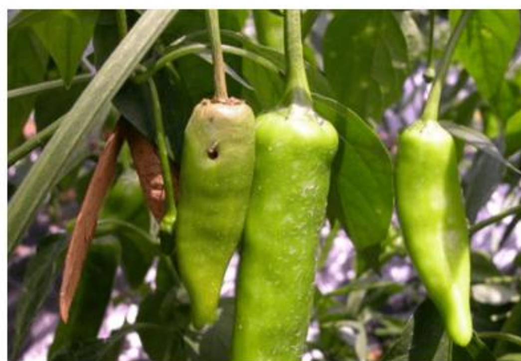
【담배나방 애벌레 가해 열매】