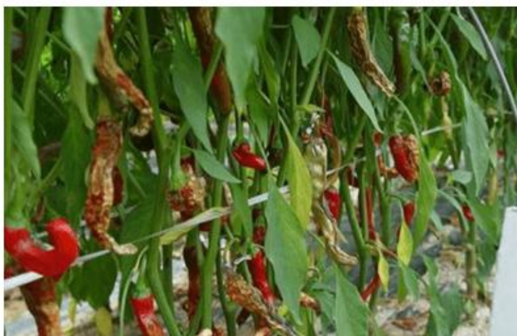
【고추 탄저병 발생포장】