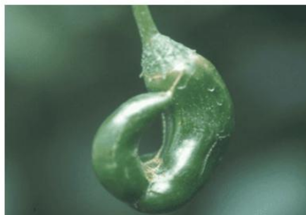
【꽃노랑총채벌레 피해 과실】