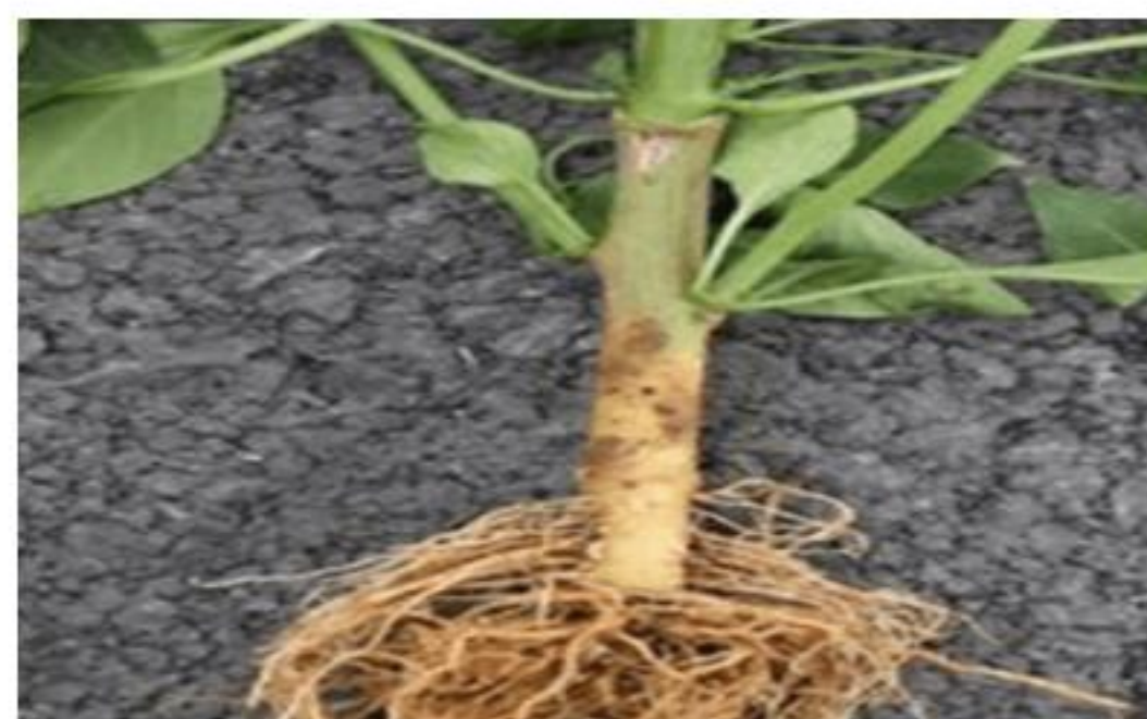
【풋마름병 발생 뿌리, 갈변】