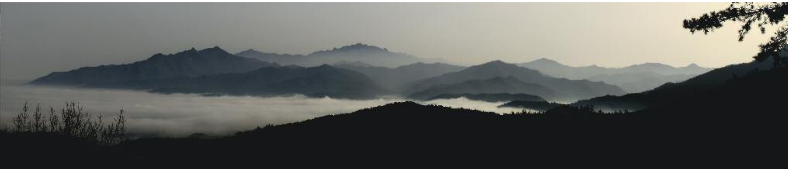
전판성 월출산 | 全判聖 月出山 200×40cm, 2013