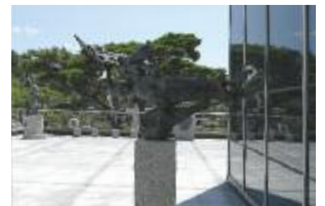
가토아키오 달로 비상하다 | 加藤昭男 月に飛ぶ