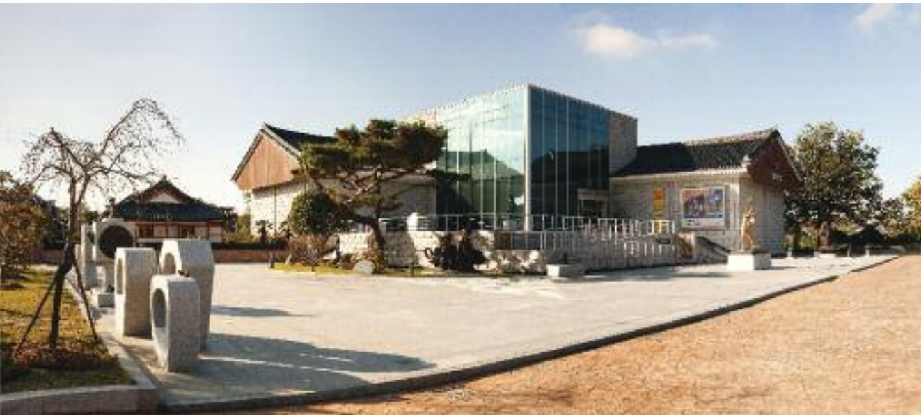
미술관 전경 美術館 全景