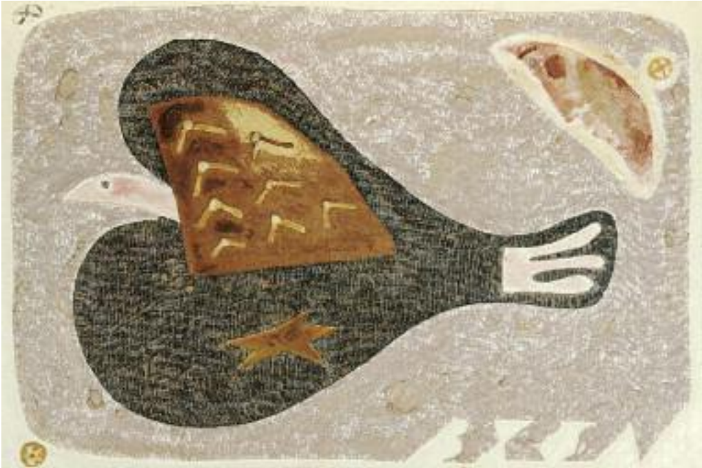
변종하 卞鐘夏 | 밤에나는 새, 캔버스에 유채 夜に飛ぶ鳥, 油彩 | 116.7×80.3cm, 미상