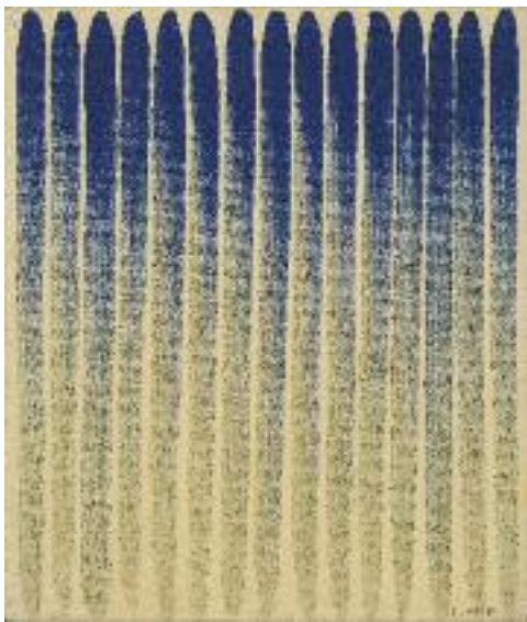
이우환 李禹煥 선으로 부터, 캔버스에 유채 FROM LINE, 油彩 | 45×52cm, 1984