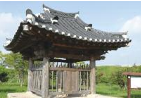
정원명석비 (문화재자료 제181호)

1565年(明宗20年)朴奎情、林浩などが中心になって組織した郷村社会の同契である。文祿慶長の役でしばらく中断したが17世紀初めから改修を繰り返し、現在まで継承されている韓国の代表的な伝統文化遺産である。