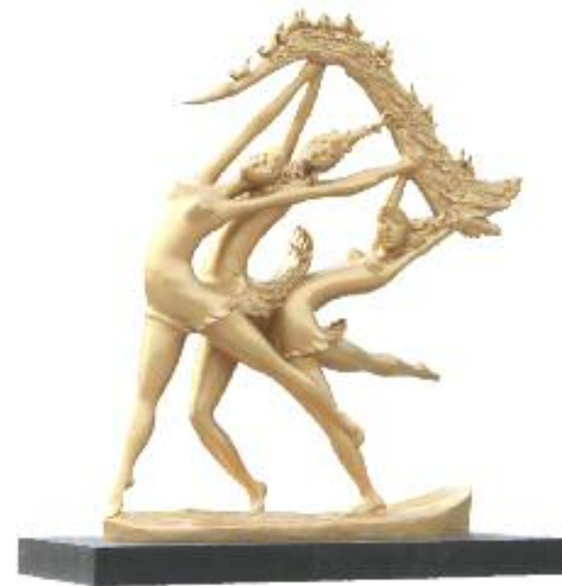
정윤태 꿈을 향해 비상하는 새들 | 鄭允台 夢に向けて飛び立つ鳥たち