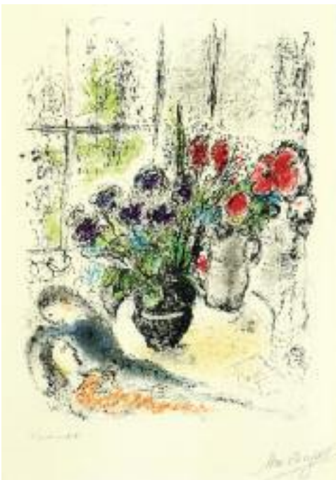
마르크샤갈 Marc Chagall 연인들의 꽃다발, 판화 恋人たちの花束, 版画 | 48×64cm, 1976