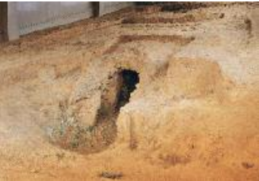
영암구림리요지 (사적 제338호)

1986년과 1996년 이화여자대학교 박물관에 의해 조사된 통일 신라말 대규모 도기 생산단지로 광구병, 사각편병, 주름무늬 유병, 단지, 시루 등 일상생활용 도기와 유약을 바른 도기(施釉陶器)가 출토되었다.