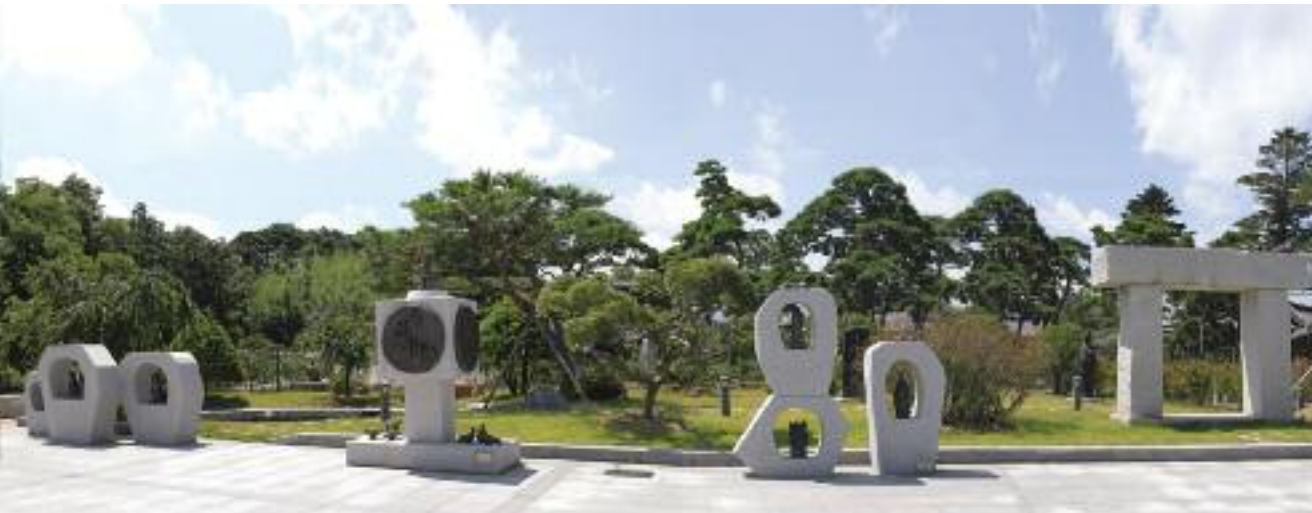
박병희 윤회, 하정웅 미완의 문 | 朴炳熙 輪回、河正雄 未完の門