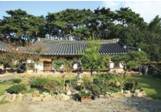
조종수가옥 (지방민속문화재 제35호)

この石碑には統一新羅時代に造られた全羅南道最古の金石文がある。碑文には唐、貞元2年(786年)の年号が刻まれている。碑文は全部で42文字だが、合香、香藏などの語句があり、仏教に関連した埋香碑であると推定される。