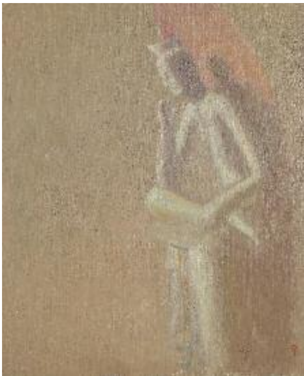
전화황 全和凰 미륵보살, 캔버스에 유채 弥勒菩薩, 油彩 | 60.5×72cm, 1976