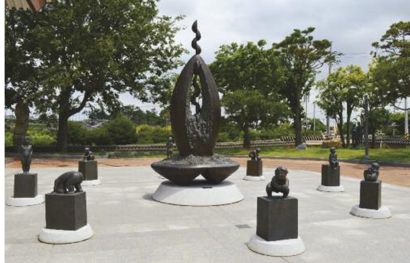
박병희 생명의 순환 | 朴炳熙 生命の循環