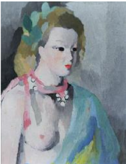
마리로랑생 Marie Laurencin 여인, 캔버스에 유채 女人, 油彩 | 30×38cm, 미상