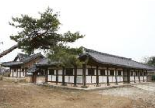
구림대동계 (문화재자료 제198호)

1986年と1996年に梨花女子大学博物館によって調査された。統一新羅時代末期にあった大規模な陶器生産団地から広口瓶、四角扁瓶、ひだ文様の油瓶、素焼きの壺、蒸し器などの生活用陶器と釉薬を塗った陶器(施釉陶器)が出土されている。