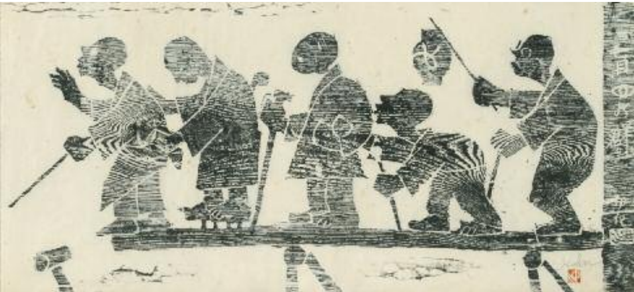
나카가와 이사쿠 맹인의 행렬, 판화 | 中川伊作 盲目の群, 版画 96.8×43.2cm, 1962

시각장애인들이 줄지어 위태로운 다리를 건너는 장면을 통해 시각장애인들의 운명을 거머쥔 지도자의 역할에 대해 생각하게 하는 작품이다. 하정웅은 이를 통해 봉사하고 베풀어야 할 휴머니즘, 그리고 사회와 민족, 역사속에서 인간이 걸어가야 할 지혜로운 방향에 대해 깨달았다. 盲人達が一列になって危ない橋を渡ろうとする場面を通して、盲人達の運命を握る指導者の役割とは何かを考えさせられる作品である。河正雄はこの作品を通して、奉仕や施しのヒューマニズム、そして社会や民族、歴史の中で人間として歩むべき道を深く悟った。