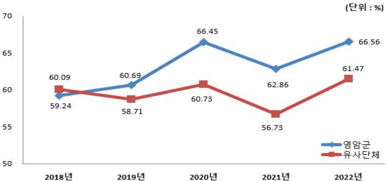
유형 지방자치단체와 재정자주도(당초예산) 비교

☞ 영암군의 재정자주도는 66.56%로 유사 자치단체 평균 61.47%에 비해 높은 것으로 나타나고 있습니다. 우리군에서는 재정자주도 상승을 위한 지속적인 노력으로 군 자율적으로 사용할 수 있는 재원 활용도를 높이고 이를 통해 군정 발전 및 군 재정 건전성 향상을 이끌어내기 위해 힘을 기울이고 있습니다.