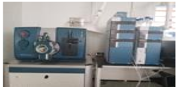
▶ LC/MSMS(잔류농약분석 기기)