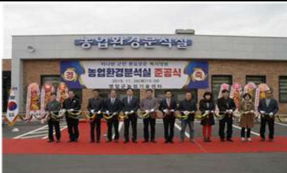
▶ 농업환경분석실 준공식