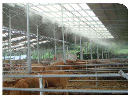
안개 분무 시설