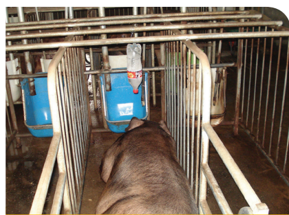
얼린 페트병을 활용한 점적방법