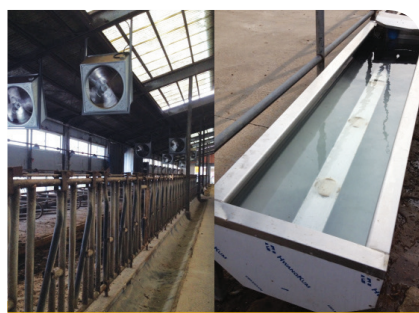
송풍기 온도조절 및 일반수조 사용