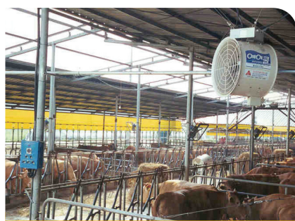
개량형 냉풍 장치