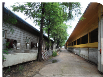
돈사주변 활용수 식재